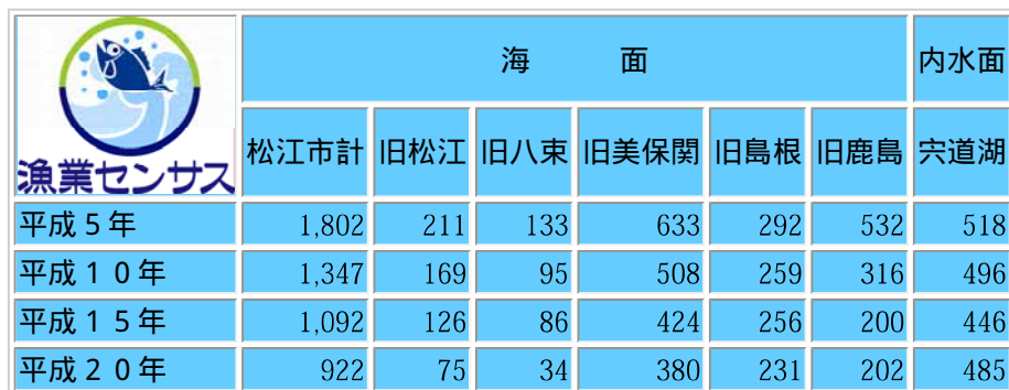
表3 漁業従業者推移（平成20年 漁業センサスより）